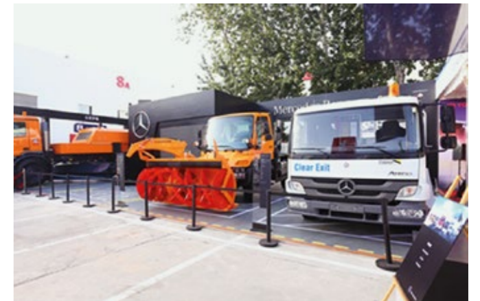
Präsentation in Peking – der neue betaDispenser von Esterer auf der inter airport China.